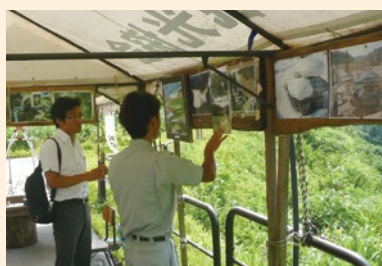
▲山古志村で震災状況を視察

佐渡市における交流定住施策や地域おこし協力隊の実施状況、ならびに佐渡金銀山の世界遺産登録に向けての動きや地域資源を活かしての振興について伺いました。