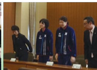
▲岡山シーガルズ県議会サポーターズ総会