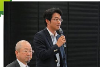
▲老施協 21 世紀委員会で挨拶

少子高齢社会において「自助・互助」によって健康寿命を延ばすことが大切です。地域の皆さんとともに認知症予防を実践。