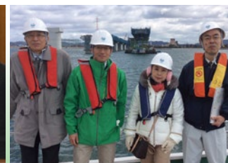
▲高梁川架橋工事視察