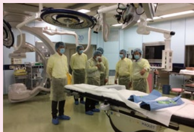
▲青年局で岡大病院視察

岡山大学病院を視察。ICUが58ベッドあり全国1、2位を誇ります。手術室にしても、その広さや設備など同様です。岡山県には全国に誇れる医療環境があるのです。