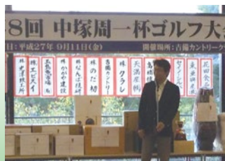
▲周一杯ゴルフ大会