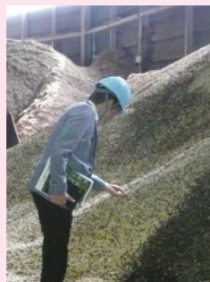
▲燃料用木質チップを手にとってみる

木材を燃料としたバイオマス発電所。林業の活性とともに地方創生のモデルとしても注目されている。