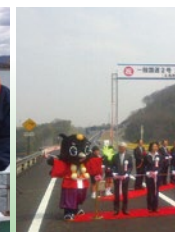
▲国道2号玉島・笠岡道路