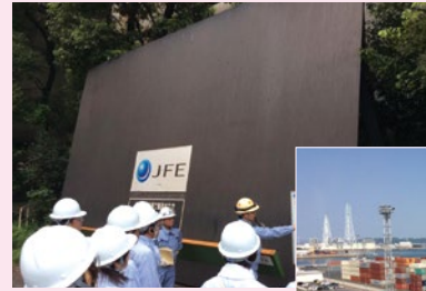
▲JFE スチール倉敷製鉄所視察

矢掛屋(矢掛町)を視察。「人を呼び込む、人に滞在してもらい、人が活躍できる、人を育てる」という地域活性の大切なキーワード。それぞれの地域、個人でその実践が輝いています。