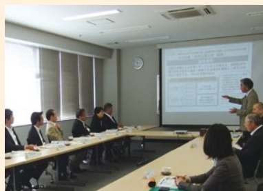
▲金沢工業大学 地域防災環境科学研究所

南海トラフ巨大災害の実効性ある防災対策を専門的に研究されている。岡山県における防災対策の参考としたい。