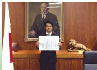
▲岡山県議会議員選挙当選証書授与式