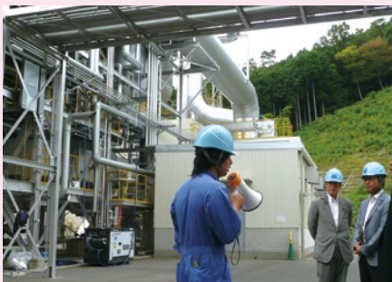
▲真庭市 バイオマス発電所

水島コンビナート・玉島ハーバーアイランドは、岡山県にとって、産業振興の重要な役割を持つエリアです。企業が操業しやすく立地メリットのある港湾環境の整備を進めていかなければなりません。